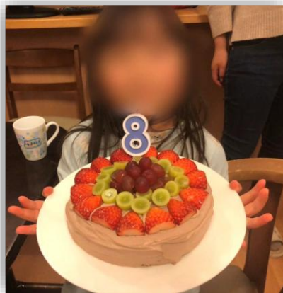
誕生日は手作りケーキも