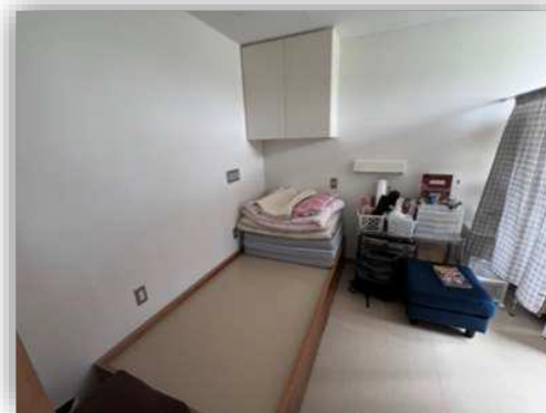
仮眠室もあります